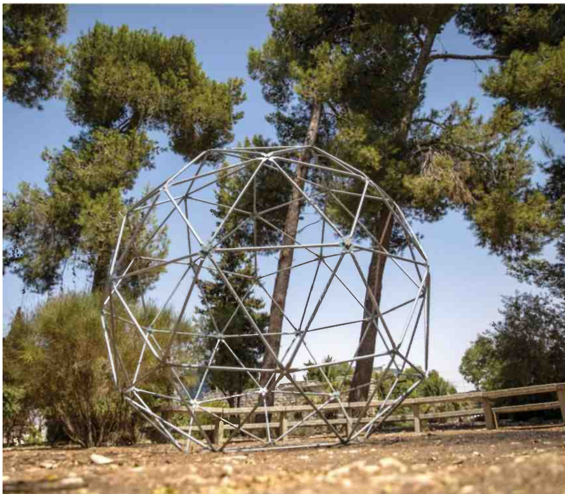
צורות וצבעים לא שגרתיים. מיצג בכפר

על מתמודדי הנפש, שגם ככה קשה להם. גם לאנשים הגילים צריך להעניק כלים לקבל אותם. "כשמתרחשת תאונת דרכים אנשים באים לבקר בבית החולים, אפילו שזה לא מקום נעים, אבל בבית חולים פסיכיאטרי לא מבקרים. לכן ניסיתי לייצר אירוע פומבי שבמסגרתו אנשים ייכנסו לתוך המרכז לבריאות הנפש. אמנות היא העולם שלי, והיא מאפשרת לבנות גשרים חברתיים".