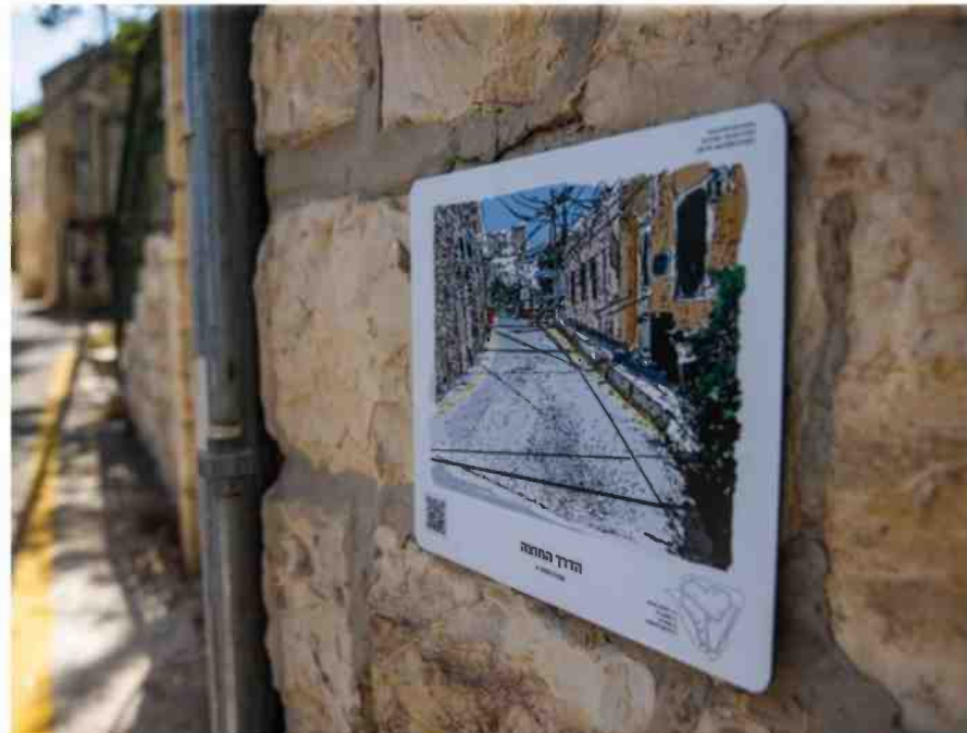
אחת משמונה התחנות שנפרסו לאורך הכפר כולו. יצירה של אפרת יגור

כנרת, אחת המטופלות: "בהתחלה פחדתי להרוס את השטיח שארגו, רציתי רק לפתוח את גלילי הצמר. האמנים הרגיעו ותמכו. הם עזרו לי בפרטים הקטנים, הסבירו שגם אם לא הייתי בדיוק בתוך הקווים זה עדיין בסדר"