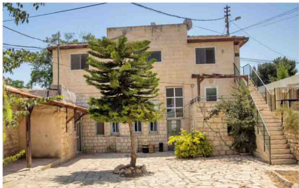
המרכז הגדול מסוגו בירושלים והשלישי בגודלו בארץ. ביה"ח כפר שאול

"אספתי בדלי סיגריות מכל המחלקות ומהחצר, ויצרתי מיציג שמורכב מ-6,000 בדלים. שישה קילוגרם מים בסך הכל". את בדלי הסיגריות היא הניחה בתוך