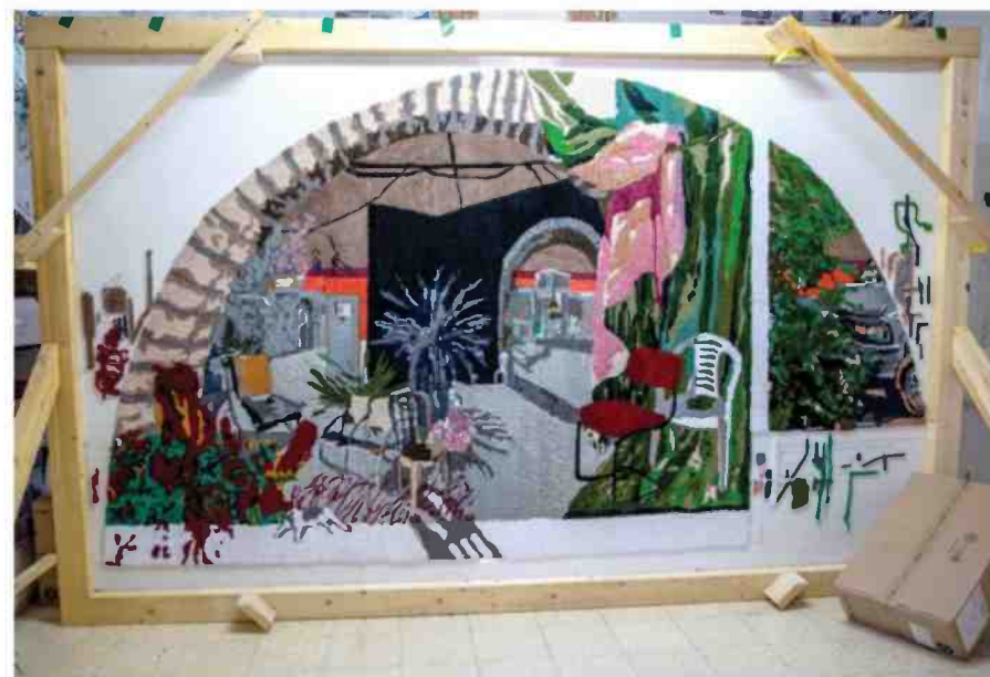
יצירה מתוך התערוכה

את מסתירה מהעולם בחוץ את ההתמודדות שלך? "אני באשפוזים חודרים מגיל 16, המשפחה שלי אוהבת ותומכת. הם ליוו אותי ואני יודעת שיעשו הכל בשבילי. הם באו לבקר אותי כמעט כל יום. עשיתי