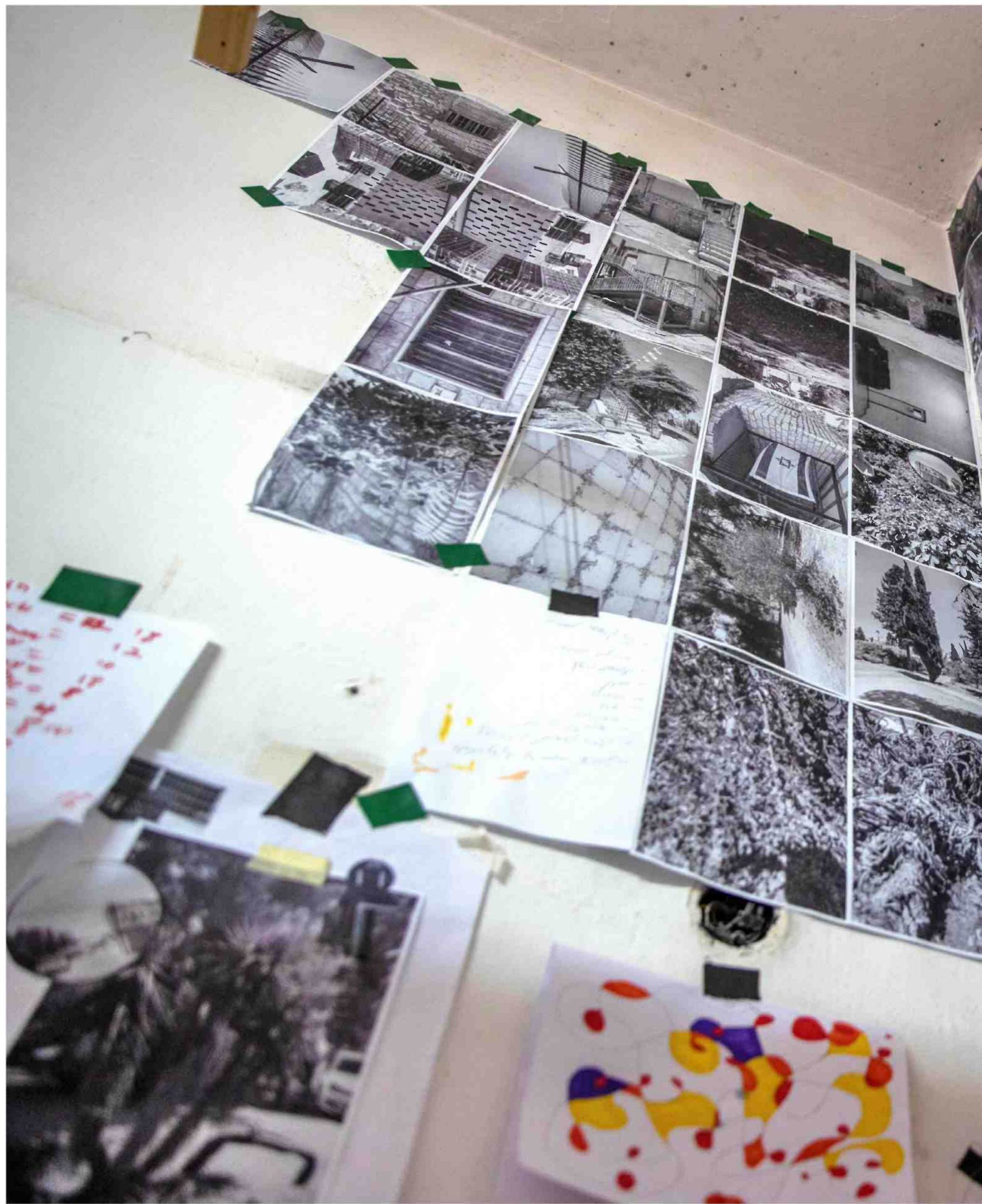
קיר עבודות של מטופלים בכפר שאול