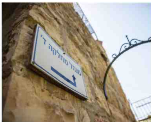
מלאכה תרפויטית. הכניסה למחלקה ד'

משם הדרך לדיכאון היתה קצרה. "זה לא דיכאון לאחר לידה", היא מקפידה לציין.